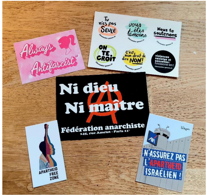
Image de gauche : la table à flyers répertoriant des événements militants et culturels à Genève Image de droite : quelques stickers gratuits distribués à la librairie