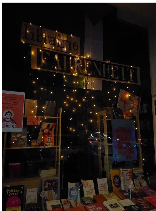
Image de gauche : les rayons de littérature, avec certains ouvrages en facing pour permettre de les visibiliser Image de droite : la vitrine de la librairie la nuit, avec la guirlande lumineuse