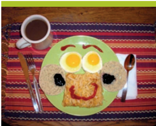
Figure 3. Régime alimentaire avec plaisir