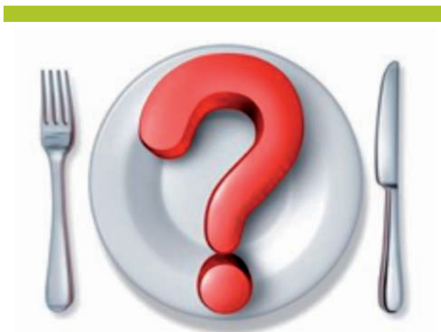
Figure 2. Alors quel est le meilleur régime?

Une étude récente, publiée dans le JAMA , a mené une méta-analyse pour estimer l'efficacité relative des différents