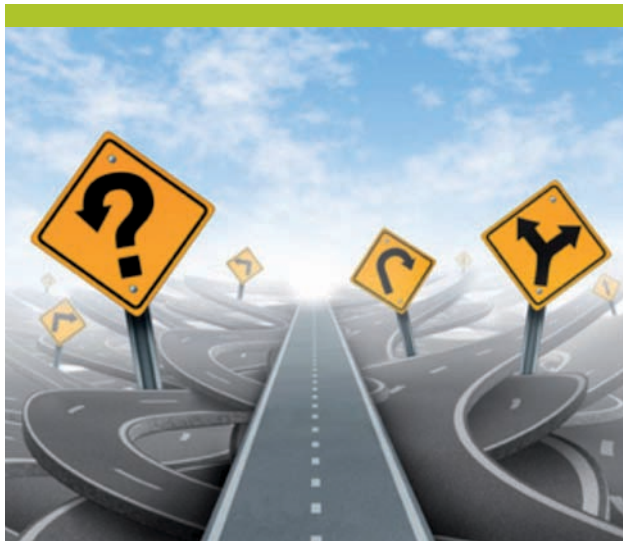
Figure 1. Quelle est la meilleure voie pour perdre du poids?

sulte en un régime à faible densité d'énergie qui améliore la satiété en raison du grand volume de nourriture qui peut être consommé. 6