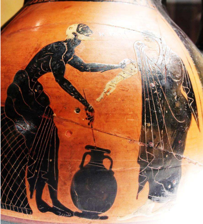
Figure 5 : Péliké attique à figures noires, Florence, Musée archéologique national 72732. 510 / 500 av. J.-C. Scène de vente : le vieux marchand représenté à gauche est chauve, cheu et maigre.

la maigreur excessive ou, son contraire, l'embonpoint : traits extrêmement rares (cf. figure 5).