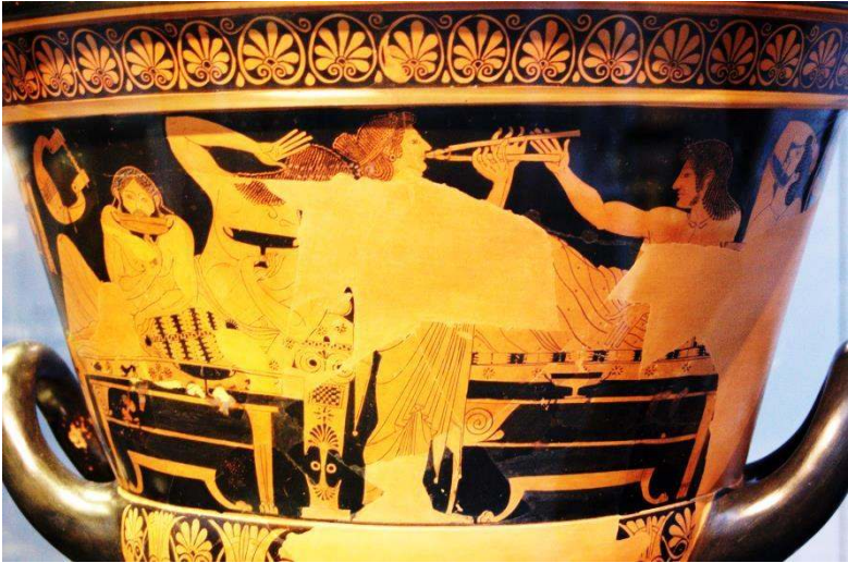
Figure 8 : Cratère attique à figures rouges, Munich, Staatliche Antikensammlungen 8935. Environ 510 a. C. Scène de symposium : une hétéaire joue du double aulos. Son double menton marqué de plis la caractérise comme âgée.