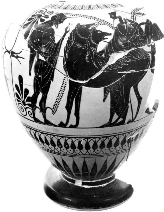
Figure 2 : Amphore attique à figures noires, Genève, Musée d'art et d'histoire 27878. 520 / 510 a. C. Scène se déroulant aux Enfers : on reconnaît à droite Hadès, représenté chauve, avec barbe et cheveux blancs.

les cheveux et/ ou la barbe blancs : trait utilisé autant que la calvitie et souvent en combinaison avec cette dernière (cf. figure 2) ;