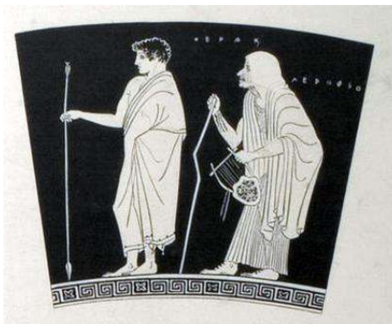
Figure 4 : Skyphos attique à figures rouges, Schwerin, Staatliche Museen 708. Vers 470 a. C. Héraklès accompagné de sa nourrice Géropsô : elle a le dos voûté et s'aide d'une canne pour marcher. Le schéma reprend celui mis en place à l'époque archaïque. D'après A. FURTWÄNGLER & K. REICHHOLD, Griechische Vasenmalerei , Munich, Bruckmann, 1927, III, V, pl. 163, 1.

le dos voûté, les jambes pliées assortis d'un bâton / canne : trait le plus caractérisant, car utilisable avec tout type de matériau, mais très rare (cf. figure 4) ;