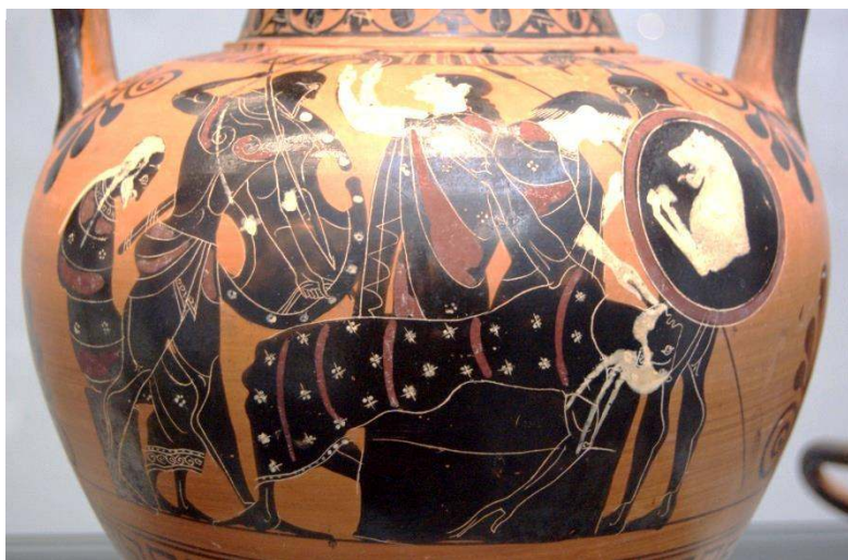
Figure 9 : Amphore attique à figures noires, Wurtzbourg, Martin-von-Wagner-Museum, L 179. Environ 510 a. C. Scène d'Ilioupersis : Priam, caractérisé comme un vieillard par la blancheur de sa barbe et de ses cheveux, est tué par Néoptolème, tandis qu'un autre vieillard, chenu et légèrement chauve, est assis à gauche.

rois et pères de héros font leur apparition 34 . Un type de personnage caractéristique de cette période est le « vieillard anonyme » : les scènes de l'épopée sont souvent flanquées d'un ou plusieurs vieillards (souvent deux, jusqu'à quatre) qu'on ne peut rattacher d'aucune manière à l'action (cf. figure 9).