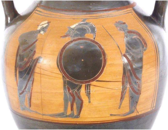
Figure 7 : Amphore attique à figures noires, Baltimore, Walter Arts Museum 48.13. 520 / 510 a. C. Départ de guerrier anonyme évoquant un modèle épique.

les personnages mythologiques / épiques (cf. figure 3, supra p. 43) ; les personnages « profanes » mais imitant un modèle mythique (cf. figure 7) ;