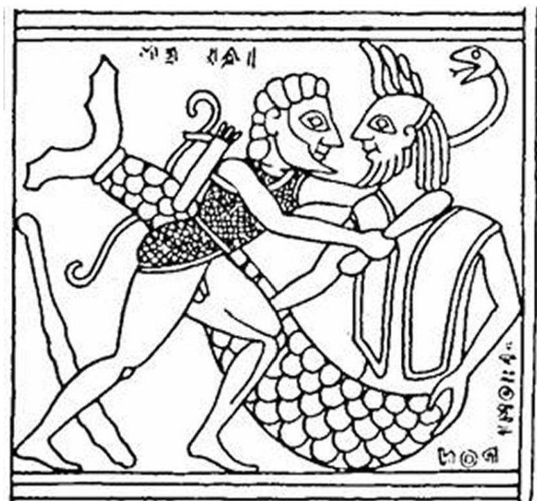
Figure 6 : Dessin d'après le détail du brassard d'un bouclier en bronze, Olympie, Musée B 1881. Environ 550 a. C. Héraklès saisit Nérée (désigné par une inscription comme Halios Géron, le Vieux de la mer) à bras le corps : Nérée est chauve.

Les personnages représentés vieux peuvent être répartis en quatre groupes : les divinités (cf. figure 2, supra p. 42 et figure 6) ;