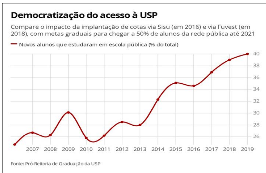
Figura 01: Evolução de matrículas de alunos provenientes de escolas públicas na USP de 2007 a 2019