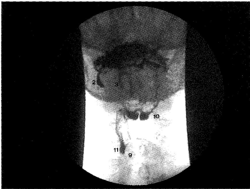
Fig. 1. — Séquence de vidéofluoroscopie de face (impression d'une image arrêtée sur une imprimante vidéo).

Durant l'examen, il est important de noter la vitesse de déglutition et la position du patient, afin de déterminer s'il y a utilisation d'une position de compensation, c'est-à-dire une attitude particulière que le patient adopte pour faciliter la déglutition (4). Elle se caractérise en général par un redressement ou une flexion du buste, une flexion, un basculement ou une rotation de la tête.