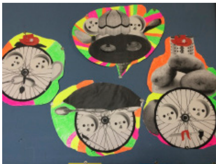
Figure 1 : activité des visages à partir du collage

Dehors il y a des visages avec des compositions exposés, (...) ils avaient des formes photocopiées de différentes grandeurs et ils avaient des consignes, les consignes étaient orales : voilà vous prenez 5 objets et vous devez former un visage. Les objectifs étaient la création, ce n'est pas à la manière de non plus, en tout cas je ne leur ai pas montré autre chose que l'on pourrait faire à la manière de, puis c'était la créativité. Après je me suis rendu compte que certaines photocopies induisaient quelque chose, je n'aurais pas dû en mettre autant, il y avait une photocopie d'une roue de vélo, donc ils l'ont tous utilisé pratiquement pour faire le visage. Enfin ce sont des choses qu'on se rend compte un peu après, en faisant.