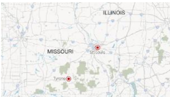
Graphique (Joseph J. Aldridge, CNN 2015b)