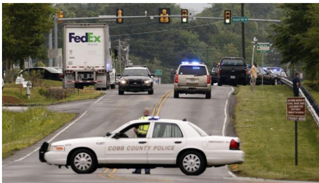
Forces de l'ordre (Geddy Kramer, CNN 2014b)

quatre catégories listées ci-dessus. Ainsi donc, lorsque les photographies représentent le suspect, elles tombent dans la première catégorie. Lorsque celles-ci montrent en premier plan des civils, elles tombent dans la catégorie deux (même si l'on peut voir en arrière-plan des policiers). Enfin, si l'on voit au premier plan des policiers, voitures de polices ou membres des forces de l'ordre (FBI, armée etc.), les images seront comptées dans la troisième catégorie. Les graphiques sont quant à eux une catégorie spécifique d'images, recensant cartes situant les lieux des fusillades et toutes sortes de représentations statistiques (par exemple le nombre de shootings dans une année donnée, Fox News 2016a). Voici quelques exemples :