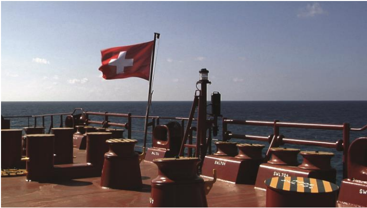
© L'île sans rivages (2018), Close Up Films