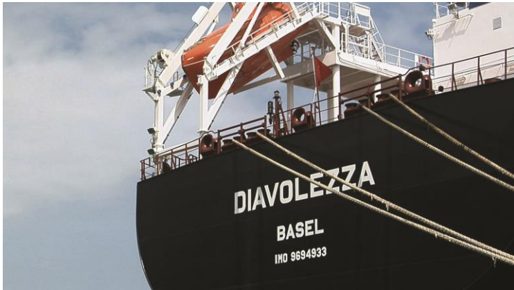
© L'île sans rivages (2018), Close Up Films