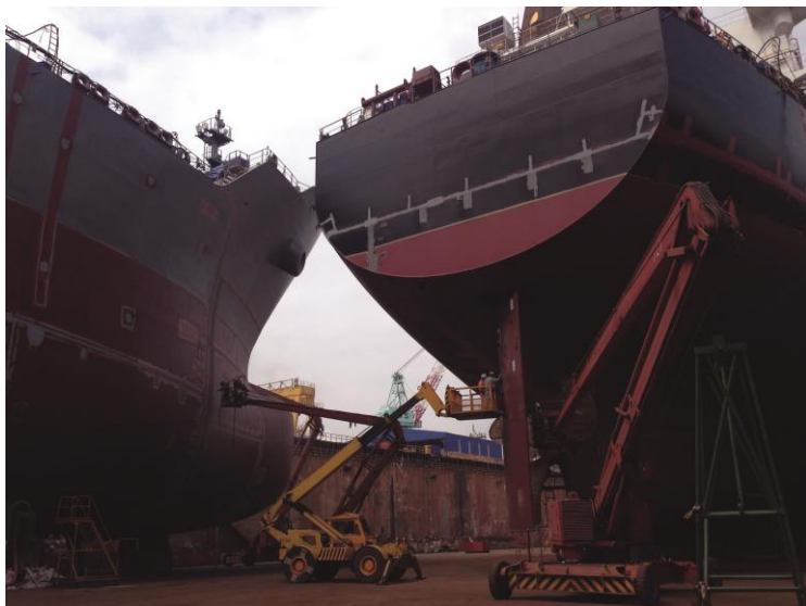
© L'île sans rivages (2018), Close Up Films