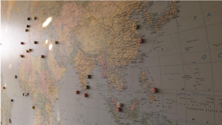
© L'île sans rivages (2018), Close Up Films