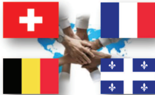
Figure 5. Fédération internationale des associations de neuropsychologues francophones

tualiser les ressources et les énergies afin de contribuer au développement de la spécialité autour de problématiques communes et de projets partagés, et sans doute de renouveler la rencontre de nos associations lors de congrès à venir!