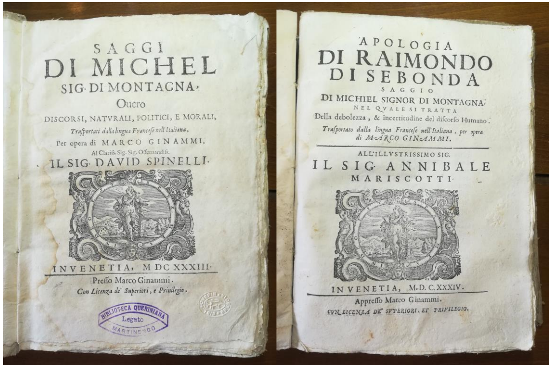
Fig. 2 - [9a.B.II.7m1-m2], Biblioteca Queriniana, Brescia, pages de titre.