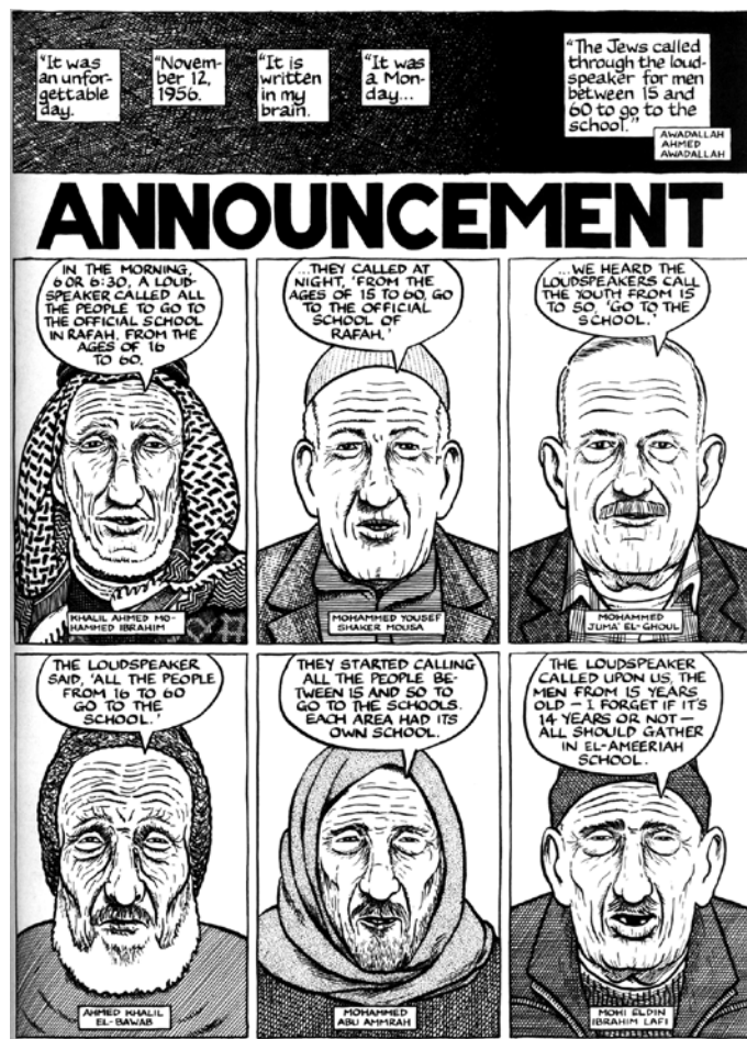
Las fuentes directas, materia prima de Notas a pie de Gaza

El dibujo fue, junto con la caricatura, la forma expresiva iconográfica más utilizada en la prensa hasta la perfección del huecograbado en 1880. Las principales imágenes que documentan los conflictos armados del siglo XIX no fueron fotografías del campo de batalla, sino ilustraciones de dibujantes a sueldo de diarios y revistas: “Hay fotografías de la Guerra Civil [Americana], pero siempre después de las batallas, porque las cámaras necesitaban exposiciones de cinco a diez minutos” (Mackay, 2008). En un momento de gran demanda informativa y lucha