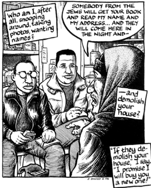
El dibujante-reportero Joe Sacco, grabadora en mano.

nace en la historieta, como resultado de una larga evolución en búsqueda de nuevos cauces de expresión y ofrece, desde los productos autónomos del medio, los frutos más sofisticados de hibridación entre las sintaxis del cómic y los géneros periodísticos. Comic journalism, graphic journalism, novela gráfica, cómic-periodismo, cómic de no ficción, cómic-reportaje, reportage en bande dessinée, récit graphique, giornalismo a fumetti o giornalismo illustrato son algunos de los neologismos que industria, crítica y lectores emplean para etiquetar una vasta diversidad de trabajos de explosión reciente y en producción ascendente, bajo la premisa de la no-ficción y con resultados que oscilan entre el relato autobiográfico y la narración fáctica con códigos importados del periodismo. Es objetivo de este trabajo ofrecer una radiografía del presente de esta novedosa corriente híbrida, explicar su génesis e identificar sus conexiones con la comunicación periodística a partir de una revisión historiográfica, tematólogica y genológica del fenómeno, con el comparativismo periodístico-literario como herramienta de trabajo.