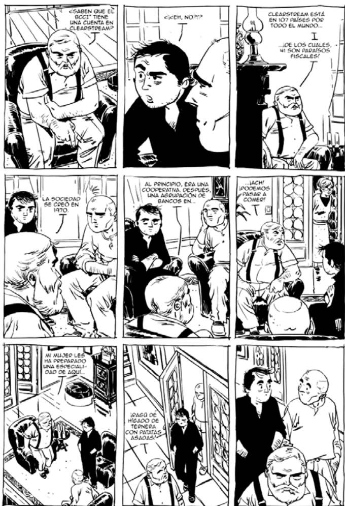
El periodista Denis Robert y sus fuentes en El Negocio de los Negocios (2009)

de artículos, un puñado de libros y diversos documentales sobre este entramado financiero luxemburgués, el ex reportero de Liberation decidió trasladar al cómic parte de sus pesquisas. El Negocio de los negocios 1. El dinero invisible (2009) y 2. La investigación (2010) 7 reconstruyen la secuencia de filtraciones, presiones interesadas y pactos con las fuentes que permitieron poner al descubierto una trama de operaciones interbancarias opacas en paraísos fiscales y comprometer al gobierno de Francia. El cómic no es el soporte madre de la investigación, sino un medio más para popularizarla. Quizá Robert dé menos de lo que promete, pero la conexión periodística queda fuera de duda y constituye un caso significativo de utilización del cómic como vehículo de información de actualidad.