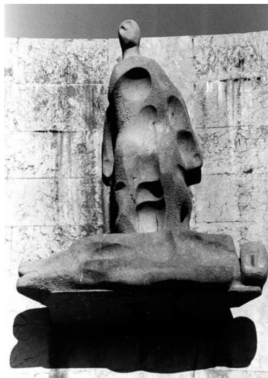
Imagen 15. Jorge Oteiza, Piedad , 1969, piedra, parte alta del conjunto escultórico que conforma la fachada principal de la Basílica de Nuestra Señora de Aranzazu, Oñate