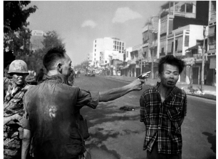
Imagen 7. Eddie Adams, Saigon execution. South Vietnamese Officer Executes a Viet Cong Prisoner , 1968

del desenlace, fatal una vez más 26 . Con todo, no es tanto el final de la secuencia interrumpida lo que más nos agrede, sino la constatación de que aquella persona (y ya no personaje) amenazado en la imagen es (o fue, si el desenlace prometido se ha cumplido) como nosotros.