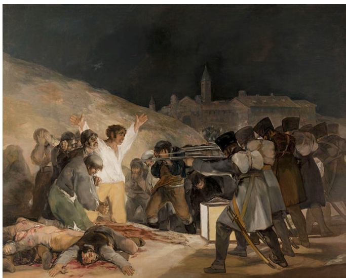
Imagen 4. Francisco de Goya, El tres de mayo de 1808 en Madrid (o Los fusilamientos en la montaña del Príncipe Pío o Los fusilamientos del 3 de mayo ), 1813-1814, óleo sobre lienzo, 268 x 347 cm, Museo del Prado, Madrid

Efectivamente, las escenas mitológicas, en tanto que se mueven en el territorio de la ficción, no generan la misma empatía que aquellas protagonizadas por nuestros semejantes; sin embargo, a medio camino entre la mitología y la historia podríamos situar las escenas de la Historia Sagrada, al menos sus pasajes más célebres. Estos tienen una dimensión popular debido a la misma naturaleza ambigua de Dios, carne y esencia; Padre, Hijo y Espíritu Santo. Así, las escenas de la Pasión de Jesús despiertan un sentimiento de identificación (al menos entre los creyentes) en tanto que Él también fue como nosotros somos. Si atendemos a la obra de el Greco (imagen 5) veremos cómo la estrategia de acercamiento que se utiliza en este caso es el subrayado de la previsibilidad: detener la historia en un momento de la Ascensión al Gólgota, para subrayar así el fuera de campo inmediato al que se dirige la imagen: la Crucifixión.