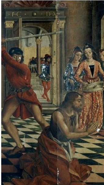
Imagén 8. Pedro Berruguete, Decapitación del Bautista , 1483-1485, óleo sobre tabla, 135 x 75 cm, Iglesia de la Asunción de Santa María del Campo, Burgos.

con el dolor de nuestro semejante, y hace que nuestra reacción no sea la misma ante, por ejemplo, estas dos imágenes: