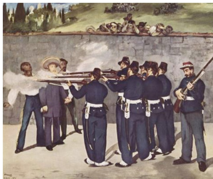
Imagen 10. Édouard Manet, L'execution de Maximilien , 1867, óleo sobre lienzo, 252 x 305 cm, Galería Nacional, Londres.

una identificación inmediata: en primer lugar, el soldado de la parte derecha, que carga su fusil, distraído, como si el fusilamiento no fuera un acontecimiento crucial; por otro lado, los espectadores al fondo de la tela, que miran el espectáculo desde el muro, situados en relación especular con nosotros, ambos testigos de la escena; asimismo, la cercanía del fusil y el fusilado, inverosímil, que resta realismo al acontecimiento y, por último, el hieratismo de todas las figuras, tanto de las víctimas como de los verdugos 30 .