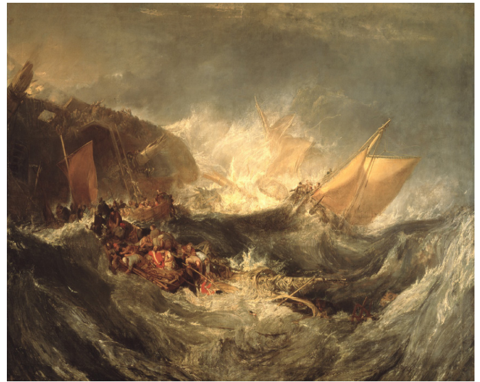
Imagen 2. J. M. W. Turner, The Wreck of a Transport Ship , circa 1810, óleo sobre lienzo, 173 x 245 cm, Museo Calouste Gulbenkian, Lisboa

Nuestro primer ejemplo, Auto de fe presidido por Santo Domingo de Guzmán , de Berruguete (imagen 3), nos muestra una escena dividida en dos partes y cuatro secuencias. En la parte superior, Santo Domingo de Guzmán dicta sentencia mientras, al fondo, un grupo de personajes esperan su juicio; en la inferior, dos hombres ya juzgados son llevados al patíbulo, en el que otros dos están siendo ajusticiados. Se trata, por tanto, de una instantánea del momento del juicio que, al mismo