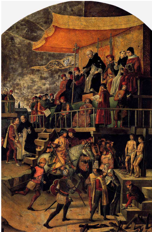
Imagen 3. Pedro Berruguete, Auto de Fe presidido por Santo Domingo de Guzmán , 1493-1499, óleo sobre tabla, 154 x 92 cm, Museo del Prado, Madrid

tiempo, propone una lectura abiertamente narrativa. Las distintas escenas que componen la obra hacen la sentencia del Santo (que ocupa la parte superior y preeminente) 21 del todo previsible: los herejes arderán en llamas. En este sentido nos encontramos ante una obra no concebida como un detalle que no remite fuera de sí misma, pero organizada de manera que propone una lectura de los detalles por separado para entender el conjunto. Y precisamente esta disposición en cuatro tiempos (espera, condena, tránsito y ejecución) lleva a que la distancia respecto al trágico destino de los pecadores sea recortada; el deleite, reducido: el tránsito hacia la muerte, primera secuencia de la escena inferior (imagen 3A), situada entre la condena y su ejecución, facilita la identificación con estos personajes. Esta composición, además de proponer una lectura exterior de los episodios representados, se revela significativa dentro del cuadro, mostrando a estos personajes su propio final y añadiendo dramatismo al conjunto.