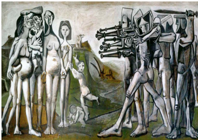
Imagen 11. Pablo Picasso, Masacre en Corea , 1951, óleo sobre tabla, 110 x 210 cm, Museo Nacional Picasso, París.

Una última cuestión presente en ambas obras y que colabora al distanciamiento es la referencia a obras previas; es decir, la propia metatextualidad, que podría considerarse una herramienta de distanciamiento en tanto que permite dibujar una escena a partir de un referente artístico, con lo que evidencia la (re) construcción de un hecho, restándole así realismo 32 .