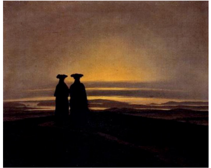
Imagen 1. Caspar David Friedrich, Paisaje al atardecer con dos hombres , 1830-1835, 25 x 31 cm, óleo sobre lienzo, Museo del Hermitage, San Petersburgo

Hechas las aclaraciones pertinentes, empecemos nuestro recorrido con dos ejemplos de esas dos acepciones de lo sublime señaladas: asombro agradable en el primer caso (imagen 1); agradable horror , en el segundo (imagen 2). Como ya hemos señalado, nos interesa seguir la vía en la que se ubica la segunda imagen: se trata de una obra de Turner surgida en el contexto histórico que hemos resumido más arriba y, como puede verse, el paisaje cumple con nota los requisitos que hemos establecido para ser calificado como sublime: disfrutamos del placer de la distancia por no estar amenazados por esa terrible tormenta que augura el previsible y trágico final de los marineros. Estaríamos pues en la parte superior de nuestro cuadro, pero lo que queremos es ver de qué manera podemos ilustrar su dos lados. Empecemos por el flanco derecho (V+); es decir, por ver las distintas formas de reducir la distancia manteniendo la previsibilidad intacta; formas de acercamiento de la distancia que serán más conseguidas en unos casos que en otros, pero lo que aquí nos interesa es atender las formas de operar, no tanto al éxito de los resultados.