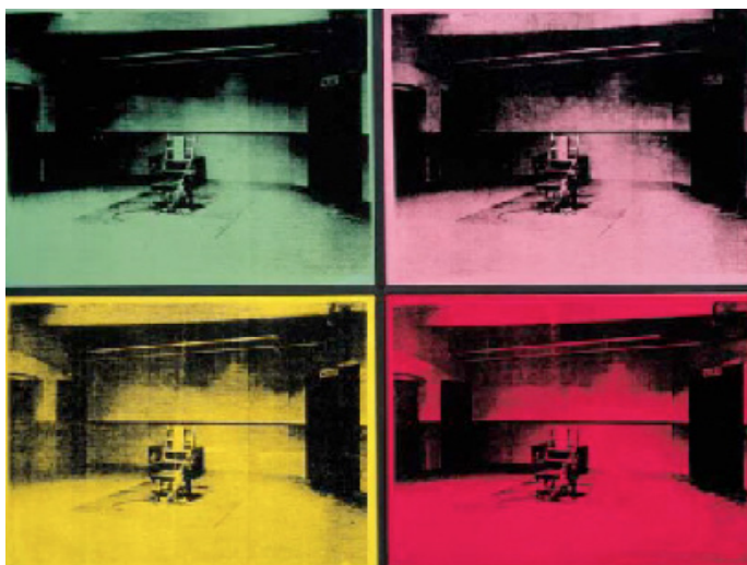
Imagen 12. Andy Warhol, Four Electric Chairs , 1964, tintas de serigrafía y polímero sintético sobre lienzo, 111.7 x 142.3 cm (56 x 71 cm cada imagen), comprado por un anónimo en Sotheby's, Londres, el 8 de noviembre de 1989 (lote 49A)