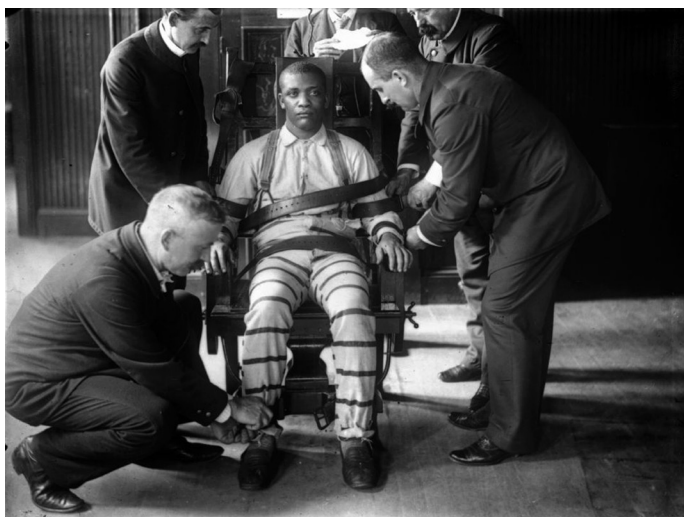
Imagen 13. W. M. Vander Weyde, Man in Electric Chair at Sing Sing Prison , ca. 1900