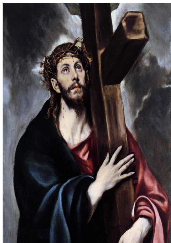
Imagen 5. Doménikos Theotokópoulos, el Greco , Cristo abrazado a la cruz , circa 1602, óleo sobre lienzo, 108 x 78 cm, Museo del Prado, Madrid