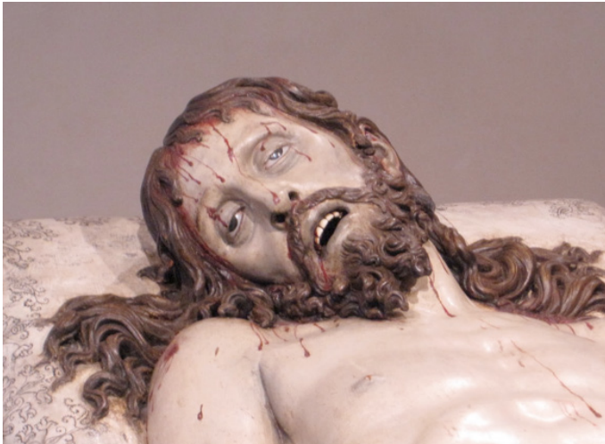
Imagen 6. Gregorio Fernández, Cristo yacente , 1627, madera policromada, Museo Nacional de Escultura, Valladolid

Y en el mismo campo religioso podemos observar un ejemplo de otra de estas formas de acercar la imagen: el recurso a un realismo exacerbado. El Cristo yacente (imagen 6) forma parte obviamente de una narrativa bien conocida y previsible; en este caso, se trata de llevar la escultura a un efecto impactante tratando de convertir, podría decirse así, la pintura roja que señala las heridas del yacente en una falsa sangre real.