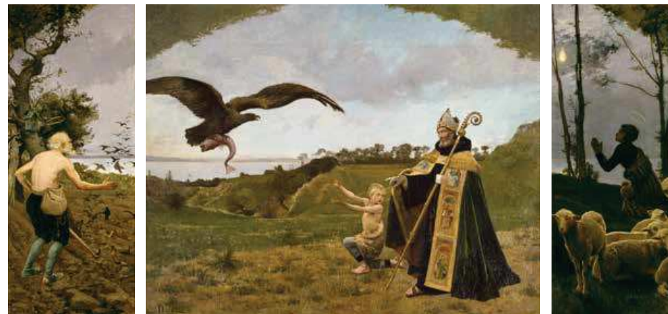
65 (ill.) Ernest Duez Légende Saint Cuthbert , 1879

Huile sur toile, 334 × 408 cm (panneau central); 334 × 134 cm (chaque panneau latéral) Paris, musée d'Orsay