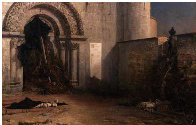
67 (ill.) Jean-Paul Laurens L'Interdit , 1875

Huile sur toile, 116 × 181 cm Le Havre, musée des Beaux-Arts André-Malraux