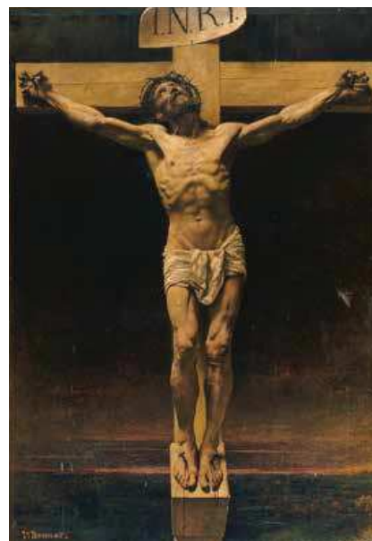
71 (ill.) Léon Bonnat Le Christ en croix , 1874

Il est vrai que le style néo-romantique d'un Henri Lévy jure avec celui, archaïsant, d'un Théodore Maillot ou celui, violemment réaliste, d'un