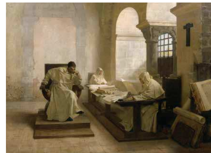
68 (ill.) Jean-Paul Laurens Les Hommes du Saint-Office , vers 1889

Huile sur toile, 145 × 195 cm Moulins, musée d'Art et d'Archéologie Anne-de-Beaujeu, dépôt du musée d'Orsay