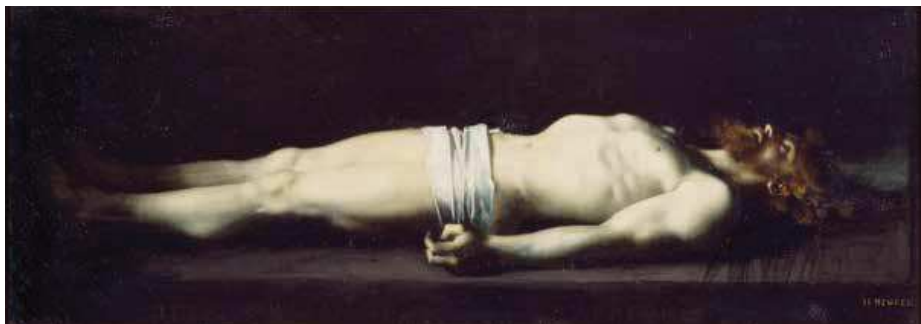
70 (ill.) Jean-Jacques Henner Jésus au tombeau , 1879

Huile sur toile, 71 × 198 cm | Paris, musée d'Orsay