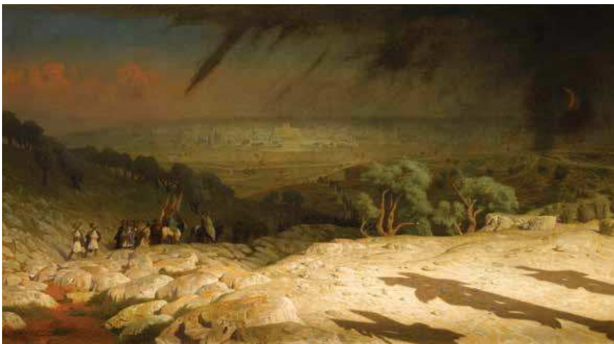
73 (ill.) Jean-Léon Gérôme Jérusalem, dit aussi Golgotha Consummatum est; La Crucifixion, 1867 Huile sur toile, 82 × 144,5 cm | Paris, musée d'Orsay

d'humbles contemporains 38 . Elle domine encore les œuvres religieuses de Maurice Denis, qui, quoique beaucoup plus jeune, fut proche de Lerolle 39 .