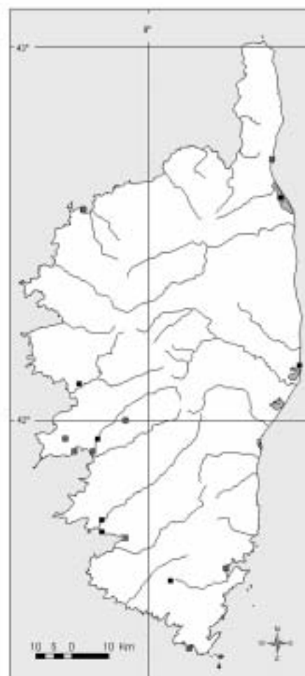
Spargula arvensis subsp. chiusseana