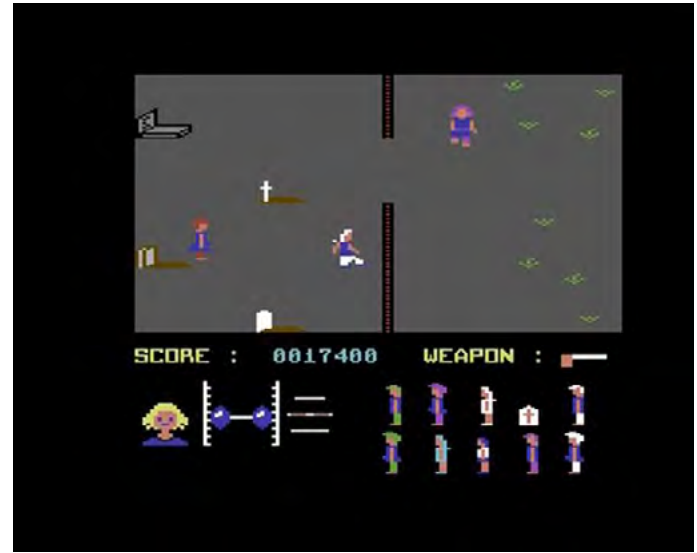
Friday the 13th

El jumpscare , en tanto recurso que parece haber signado la vida del terror fílmico y de sus subespecies (Bishop), no ha sido objeto de muchos estudios 2 . El término pertenece a la cultura popular y designa una operación mediante la cual se busca sobresaltar al espectador, muchas veces mediante la aparición de un monstruo o de un ataque sorpresivo (Draven, 2013; Muir, 2013). En un filme, esta operación suele consistir en la irrupción imprevista y agresiva de algún elemento en el campo visual o sonoro. Hanich propone una tipología de seis formas en las que el cine de terror puede sobresaltar al espectador: nos centraremos en el tipo que Hanich denomina horror shock 3 , y que consisten en la «revelación abrupta de un monstruo o de un acto de violencia» (131). A su vez, el autor describe tres vías