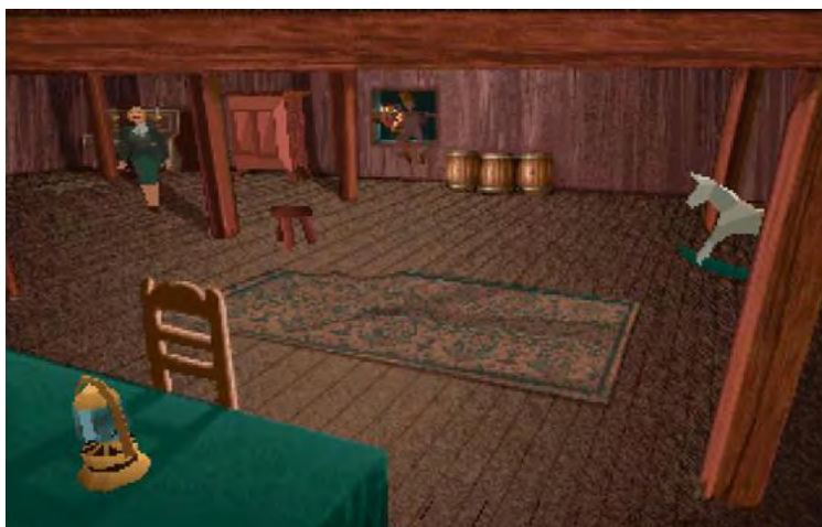
Alone in the Dark