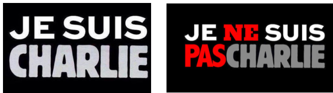
Figure 2 : Je suis Charlie vs Je ne suis pas Charlie

Peu après les attentats du 7 janvier 2015 de Charlie Hebdo à Paris, est apparu partout, sur la toile comme dans les rues, le message Je suis Charlie . Quelques heures après, le message Je ne suis pas Charlie s'est diffusé, reprenant la typographie du message Je suis Charlie , mais avec les mots négatifs en rouge (Figure 2).